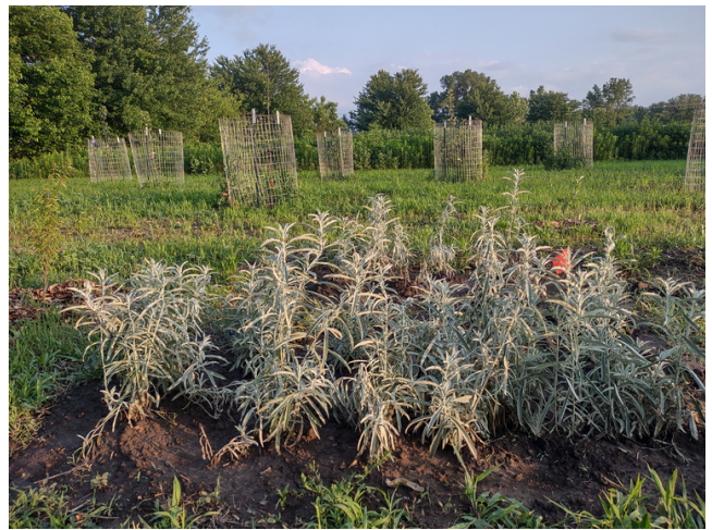
ကန်းဆပ်စ်ပြည်နယ်၊ Lawrence ရှိ Nanasoohannena Farm

နည်းဗျူဟာ 4.4 စတင်သူများ၊ ဝါရင့်လုပ်သားများနှင့် လူမှုရေးအရ ချို့တဲ့သော တောင်သူလယ်သမားများအား ကူညီပံ့ပိုးပေးရန် စိုက်ပျိုးရေးလုပ်ငန်းဆိုင်ရာ လုပ်သားအင်အား ဖော်ထုတ်ရေးအစီအစဉ် များကို ချဲ့ထွင်ပေးရန်။