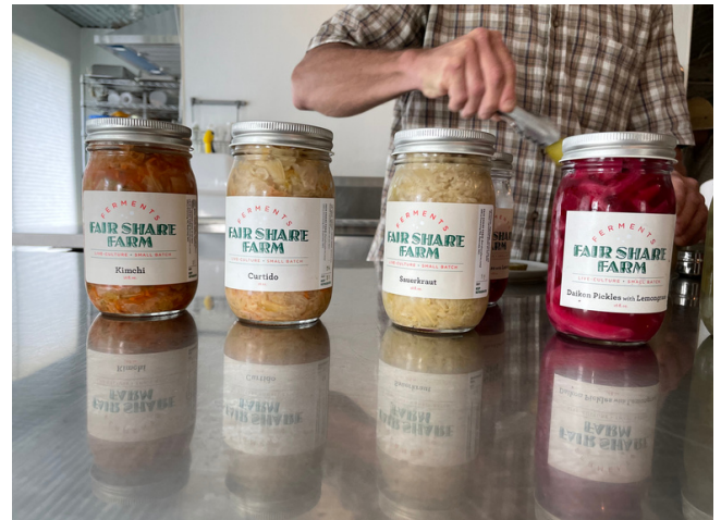
Fair Share Farm မှ အချဉ်ဖောက်သည့်အရာများ

နည်းဗျူဟာ 8.2 ဒေသဆိုင်ရာ စားနပ်ရိက္ခာစနစ်အတွက် ဒေတာဒက်ရှိ ဘုတ်ကို မြှင့်တင်ပြီး ချဲ့ထွင်ပေးရန်။