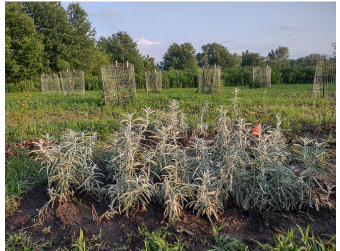
Nanasoohannena Farm en Lawrence, Kansas

Estrategia 4.4 Ampliar los programas de desarrollo de la fuerza laboral para la agricultura con el fin de apoyar a los agricultores principiantes, veteranos y socialmente desfavorecidos.