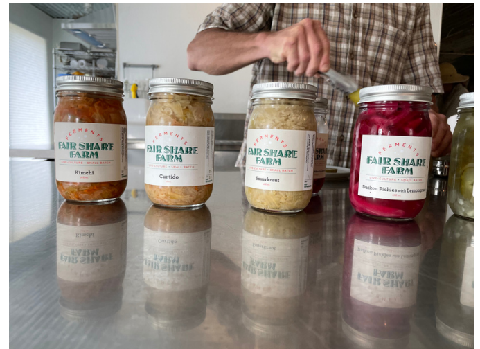
Fermentados de Fair Share Farm

Estrategia 8.2 Mejorar y ampliar el panel de datos del sistema alimentario regional.